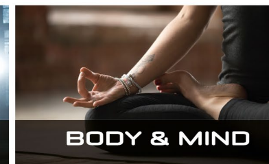
BODY & MIND